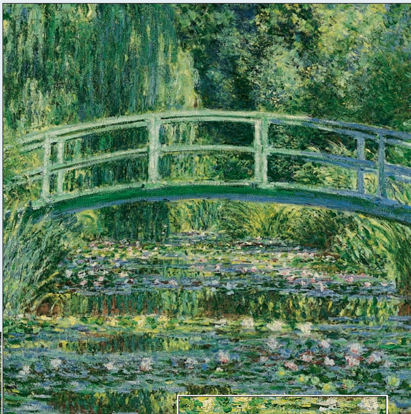
Monet, «Le pont japonais»